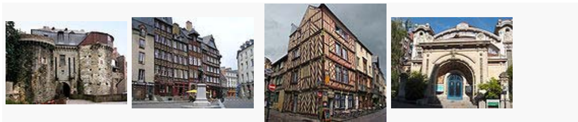
Les portes mordelaises. Place du Champ-Jacquet .